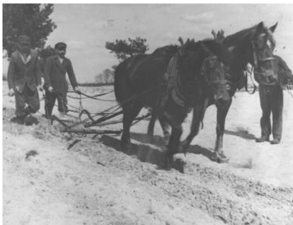
Fot.1. Przygotowanie gleby pod zalesienia – 1954 r.

Jedynym racjonalnym sposobem zagospodarowania tych gruntów było ich zalesienie – 60 lat temu rozpoczęła się wielka akcja sadzenia lasów.