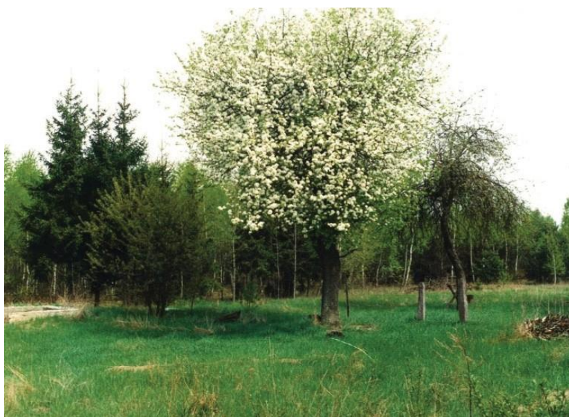
Fot. 4. Zdziczały sad i fragmenty zabudowań.

Staraniem leśników, bezleśne tereny zmieniły swój wygląd poprzez wzbogacenie krajobrazu o kompleksy leśne. Lesistość terenów Nadleśnictwa Bielsk wynosi obecnie 27% z tym, że w gminach Czeremcha, Dubicze Cerkiewne i Kleszczele sięga 50%. Mimo że większość drzewostanów Nadleśnictwa Bielsk powstała na gruntach porolnych, to znaczna ich część została objęta różnymi formami ochrony zaświadczając tym samym, że są przyrodniczo cenne.