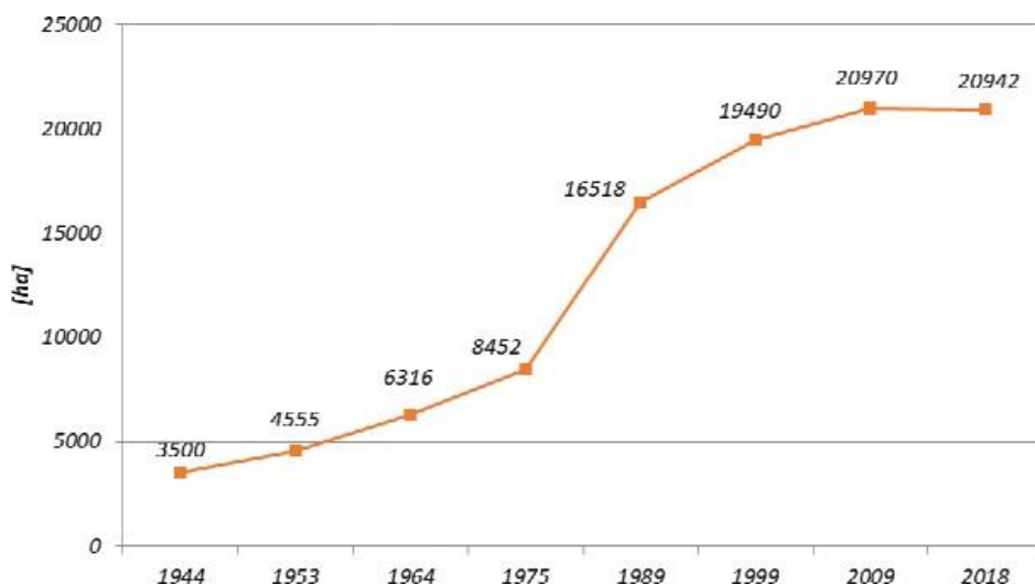
Ryc. 1. Zmiana powierzchni lasów Nadleśnictwa Bielsk po II wojnie światowej.

Nadleśnictwo Bielsk jako samodzielna jednostka w granicach zbliżonych do obecnych zostało utworzone 01.08.1944 r. z siedzibą w Bielsku Podlaskim przy ulicy Żeromskiego 13. W roku 1962 siedzibę nadleśnictwa przeniesiono na ulicę Studziwodzką 39, gdzie znajduje się do dziś. W jego skład weszły dawne lasy państwowe, lasy majątków przyjętych z reformy rolnej oraz lasy przyjęte PFZ. Jest jednostką o charakterystycznej strukturze stanu posiadania, odmiennej niż w większości nadleśnictw. Wynika to z młodego wieku drzewostanów (40 lat) i stałego wzrostu powierzchni LP. Powiększenie powierzchni LP nadleśnictwa w początkowej fazie dotyczyło przekazania Nadleśnictwu większych powierzchni nieużytków i gruntów nieopłacalnych dla rolnictwa stanowiących PFZ, gruntów po Spółdzielniach Produkcyjnych, Spółdzielniach Kółek Rolniczych i PGR-ów. Gwałtowne przekazywanie lasów i gruntów do zalesienia miało miejsce w latach siedemdziesiątych i osiemdziesiątych w związku z możliwością przekazania przez rolników gruntów na rentę. Oprócz zalesień w Lasach Państwowych większość zalesień w lasach niepaństwowych organizowała administracja nadleśnictwa. Rozdrobnione kompleksy położone w zmieszaniu z działkami rolników, często w szachownicy o kilkumetrowej szerokości działek, stwarzają ogromne utrudnienia w prowadzeniu racjonalnej gospodarki leśnej, mimo to wspólnie tworzą duże zwarte kompleksy leśne.