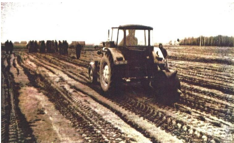
Fot.2. Pierwszy pokaz pracy koleczką. Leśnictwo Czeremcha.

Przejęte grunty w większości składały się z rozdrobnionych działek. Młody wiek drzewostanów jest wynikiem prowadzonych w okresie powojennym ogromnych zalesień w LP i LN. Zalesienia prowadzono na gruntach porolnych i nieużytkach, a także przebudowując grunty zakrzaczone na skutek długotrwałego nieużytkowania gruntów rolnych. Często przed zalesieniem, wprowadzaniem gatunków docelowych, konieczne było wykonanie melioracji, sieci dróg, małych zbiorników retencyjnych i biologicznych punktów oporu środowiska. Prowadzone prace miały poparcie miejscowego społeczeństwa. Zalesienia w większości dokonywano korzystając z pomocy młodzieży szkolnej. W rejonie przygranicznym w okolicach Dubicz Cerkiewnych, Czeremchy, a także Kleszczel w latach siedemdziesiątych i osiemdziesiątych leśnicy wspólnie z gminami i organizacjami społecznymi organizowali tzw. „zielone niedziele”, w których uczestniczyli obok leśników mieszkańcy okolicznych miejscowości, a szczególnie ich młodzi przedstawiciele. Zalesiano wtedy nieużytki porolne na gruntach lasów państwowych i indywidualnych właścicieli. Na zakończenie „zielonych niedziel” odbywały się festyny ludowe.