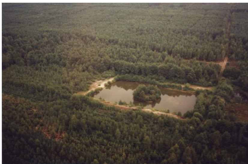
Fot. 3. Zbiornik małej retencji w Leśnictwie Kleszczele.

Na terenie nadleśnictwa brak jest większych naturalnych zbiorników wodnych. Wykorzystuje się więc lokalne obniżenia terenu do celów tworzenia małej retencji wód. O ile możliwości terenowe pozwalają, to obszary zalesiane są wzbogacane w zbiorniki wodne wielkości od kilku do kilkudziesięciu arów. Zakładane są przy nich remizy złożone z wielu gatunków drzew i krzewów liściastych tworząc punkty biologicznego oporu środowiska. Wszystko to składa się na kompleksowe zagospodarowanie.