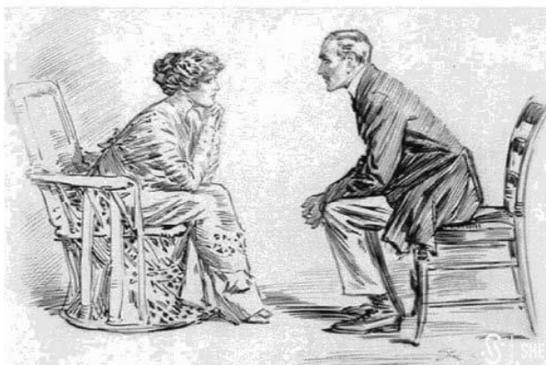
Ryc. 1. Współczesna informacja kulturowa.

Mądrość To umiejętność słuchania innych, pomimo posiadania odmiennego zdania.